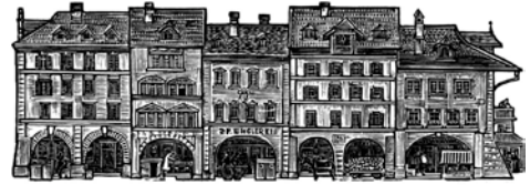
Förderverein Emil Zbinden